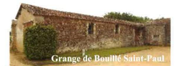
Grange de Bouillé Saint-Paul